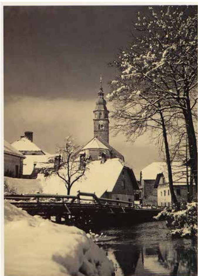
Cerknica 1960, Fotografija: Jože Žnidaršič, starejši

Vir: Dejan Vončina: Fotograf Jože Žnidaršič - Bajčk. Revija Fotoantika, št. 32, 2015.