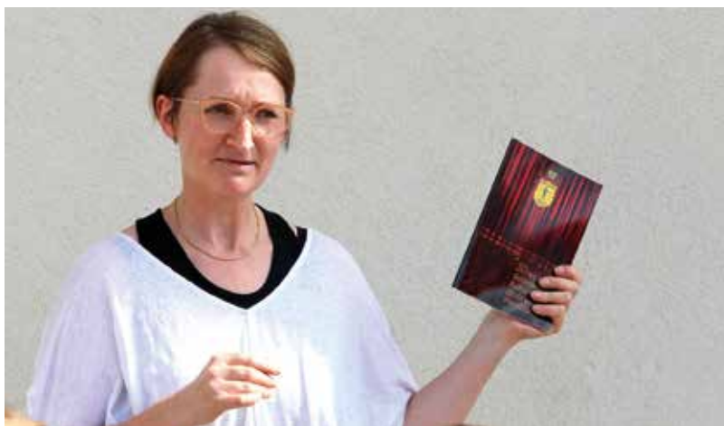
Zgodovino in dejavnosti društva so predstavili v priložnostni brošuri.