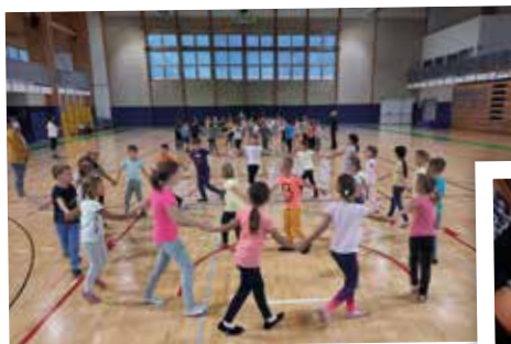
Ljudski plesi in izštevankе, učenci 1., 2. in 3. razreda matične šole

V jedilnici je na ogled razstava fotografij lokalnih športnih društev. V oktobru nas čaka še mnogo delavnic, dogajanje pa bomo sklenili s slavnostno zaključno prireditvijo Mavričnih 140 let.