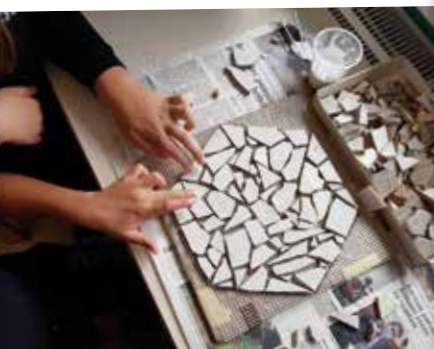
Izdelava mozaikov, 5. razred