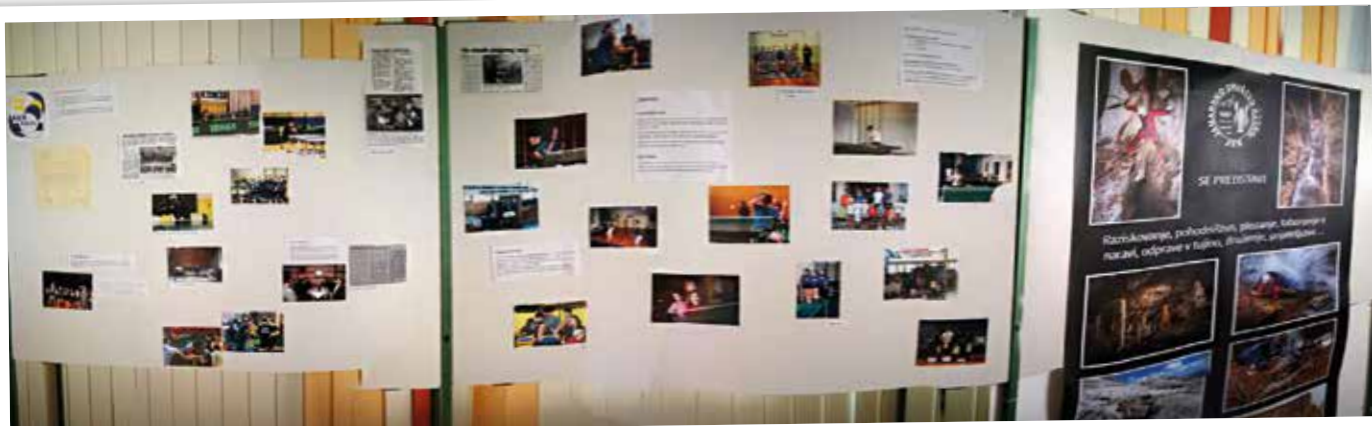
Razstava fotografij lokalnih športnih društev