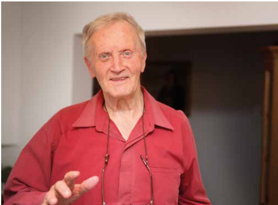
Zdaj preučuje življenjepis matematika Iva Laha iz Štrukljeve vasi.

morali vse živali izolirati. Takrat, ko je bila slinavka, se je poklalo vse krave na Marofu in Nadlesku, je šlo petsto krav in pitancev. V Cerknici sem bil slaba tri leta, potem sem dobil službo v Kmetijski zadruzi Postojna.